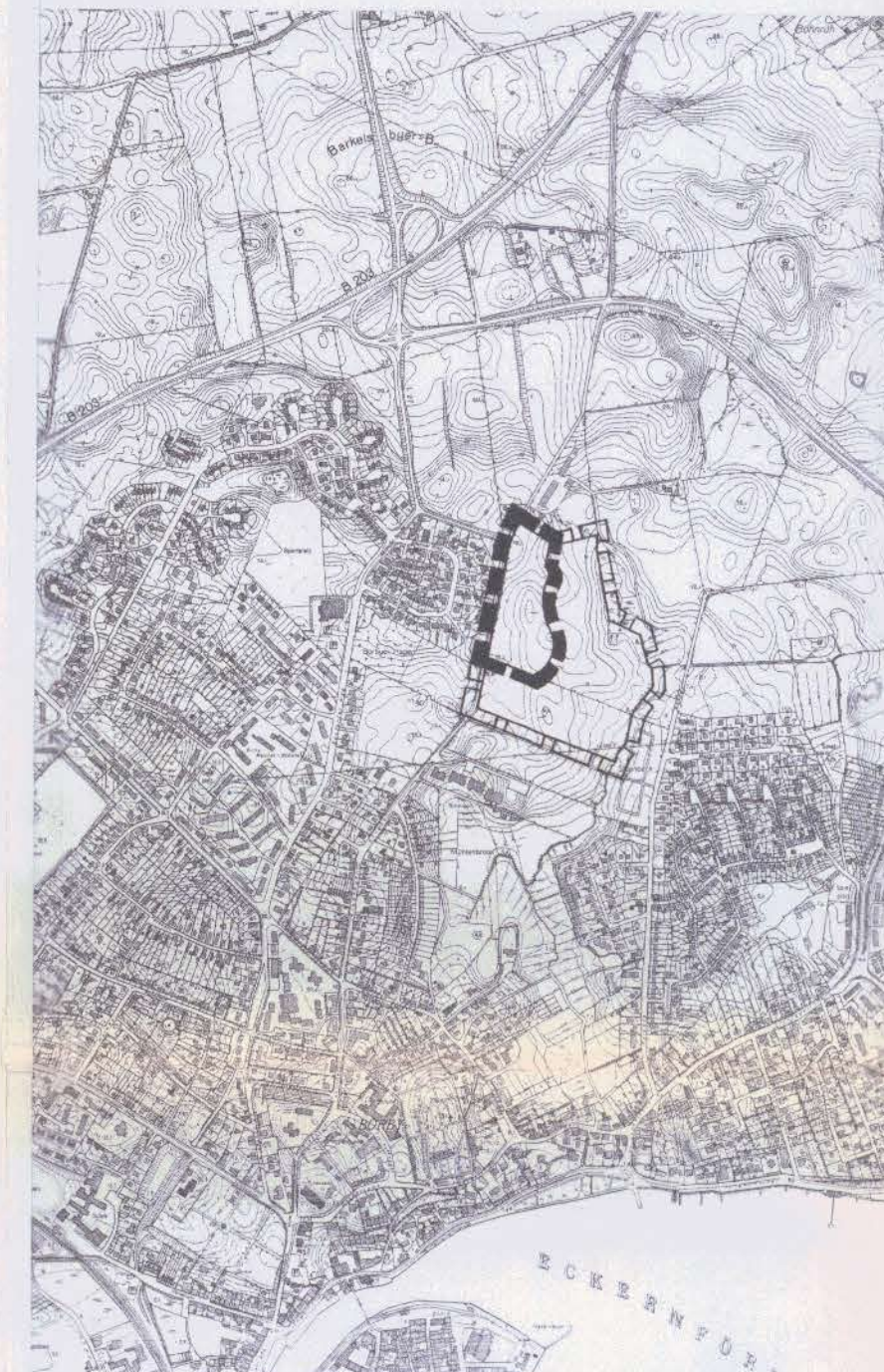
ÜBERSICHTSPLAN M. 1:10000

Der katastermäßige Bestand am 24.02.1999 sowie die geometrischen Festsetzungen der städtebaulichen Planung wurden als richtig bescheinigt.