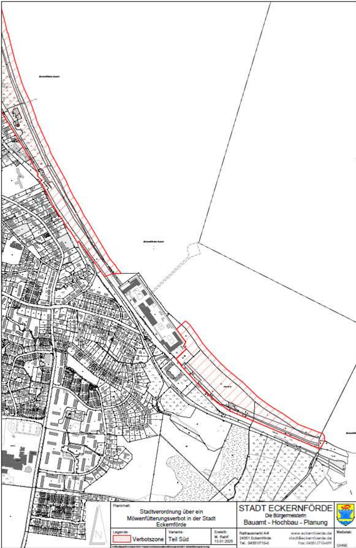
Abbildung 2 - Möwenfütterungsverbot in der Stadt - Teil Süd